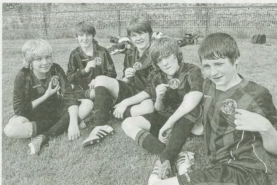
Les jeunes Anglais du Tavistock community football-club.

« L'an dernier, nous avons reçu des Roumains, des Sénégalais et