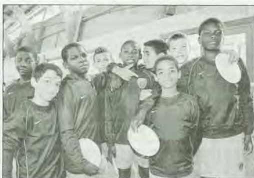
Service de restauration impeccable à Loudéac que les U13 du Paris FC ont beaucoup apprécié.

Entrée gratuite. Plus d'informations sur http://www.tournoi-international-guerledan.com