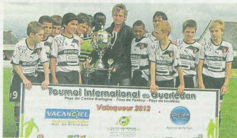
Les Rennais ont remporté la victoire, dimanche soir, face à l'EA Guingamp.

À Loudéac, le tournoi s'est terminé en fanfare, avec la finale et l'arrivée de parachutistes. Trois mille personnes ont envahi à cette occasion le stade Chevé. L'équipe de Saint-Just-en-Chaussée, dans l'Oise, a par ailleurs