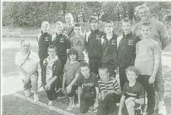
L'équipe de Saint-Just-en-Chaussée, de l'Oise, est arrivée hier soir à Toulboubou.

Arrivée des premières équipes au tournoi de Guerlédan