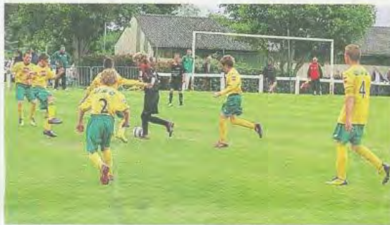
Les matchs se sont succédé, samedi et dimanche, ici, à Cléguérec.