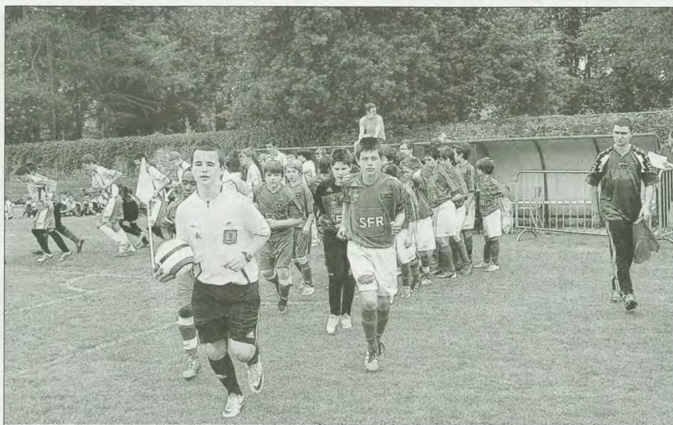
Les équipes de la GSI, inscrites dans ce tournoi ont bataillé pour faire honneur aux couleurs du club.

Plus de 1.500 jeunes footballeurs participent ce week-end au tournoi international de Guerlédan. Une manifestation sportive qui fête, cette année, son 10 e anniversaire.