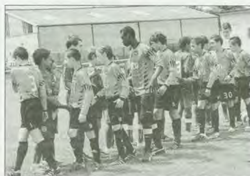
Échanges de poignées de mains, avant le match opposant l'équipe 1 du Losc à celle de Lorient, hier, à 14 h, au stade de Saint-Bugan.