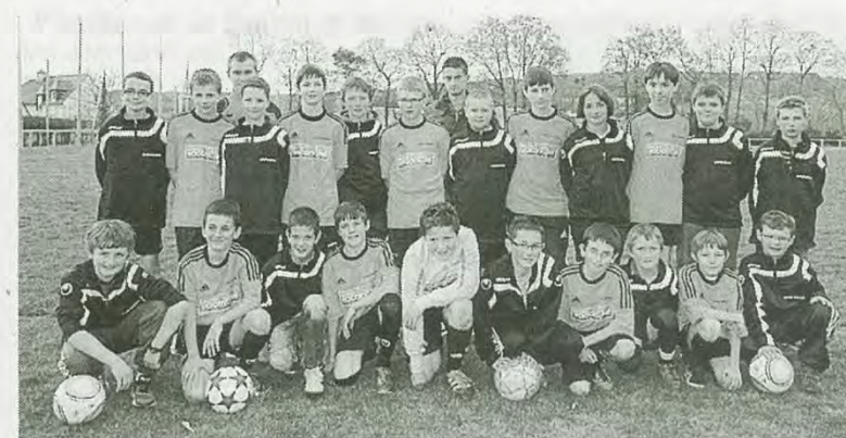
Les deux équipes U11 et U13 du Stade mûrois qui participeront au 10 e anniversaire du tournoi de Guerlédan.