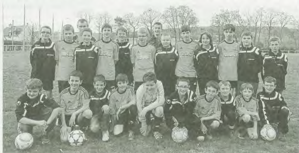
Les deux équipes U11 et U13 du Stade mûrois qui participeront au 10 e anniversaire du tournoi de Guerlédan.

Échanges sportifs et culturels La structure porteuse du projet a aussi beaucoup évolué. Aujourd'hui, les organisateurs, la GSI de Pontivy, le Loudéac Olympique Sporting-club (Locc), l'ES Neulliac, Cléguérec et le Stade mûrois, sont réunis au sein de l'association Tournoi International de Guerlédan pays du Centre-Bretagne.