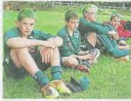
Les équipes, venues de tout le pays, ont arboré leurs couleurs.

Le tournoi de Guerlédan s'est achevé avec la victoire de Rennes, à Loudéac. Durant tout le week-end, le football était aussi en fête à Pontivy, Neulliac et Cléguérec.