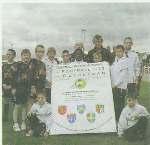
L'équipe U11 du Losc, déclarée le samedi comme la 6e de Bretagne dans sa catégorie a porté la banderole pour la finale.