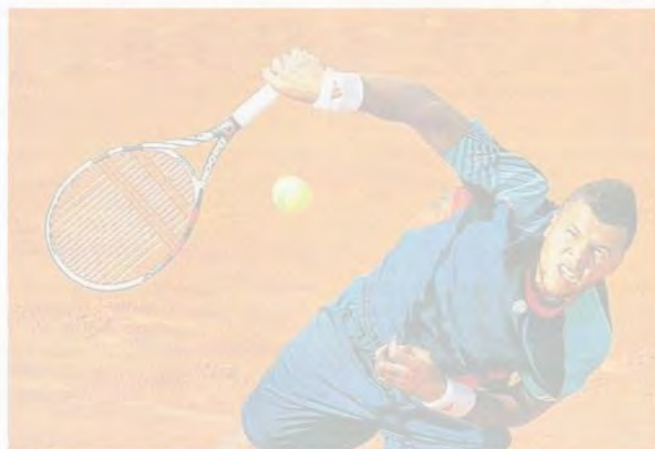
Lors de la première journée du tournoi de Roland-Garros, Jo-Wilfried Tsonga a disposé du Russe Kuznetsov (1-6, 6-3, 6-2, 6-4). page 2