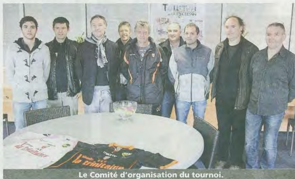
Le Comité d'organisation du tournoi.

L'édition des 2 et 3 juin 2012 s'annonce dans la droite ligne des précédentes. Le plateau sera une nouvelle fois exceptionnel, avec des équipes étrangères, des clubs de renoms, des équipes en provenance de la France entière (32 départements seront représentés), les équipes bretonnes et