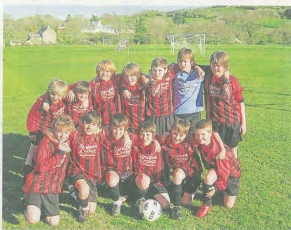
L'équipe de Tavistock, ville anglaise jumelée avec Pontivy, participera pour la première fois au tournoi.

Le tournoi de Guerlédan fête ses dix ans, ce week-end, à Pontivy, Neulliac, Cléguérec Mûr-de-Bretagne et Loudéac.