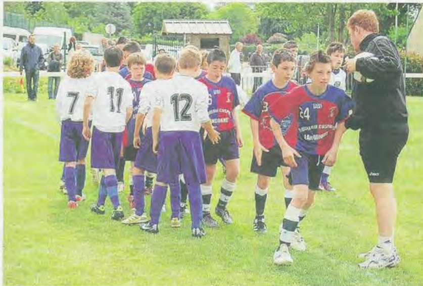
Le fair-play était de rigueur, sur le terrain, avec le salut à l'équipe adverse.

À Loudéac, le tournoi s'est terminé en fanfare, avec la finale et un spectacle des parachutistes. Trois mille personnes ont envahi à cette occasion le stade Chevé (lire aussi page Centre-Bretagne et Cahier sports).