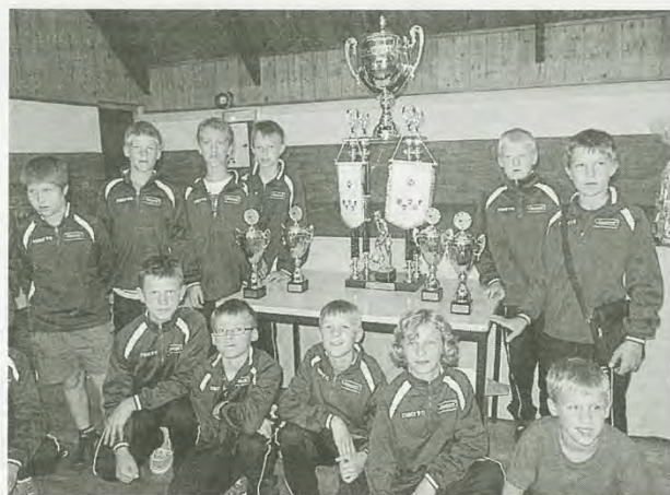
Les délégations étrangères ont été accueillies vendredi soir, à Mûr-de-Bretagne.

Dimanche , de 9 h à 13 h à Pontivy, Loudéac, Mûr-de-Bretagne, Cléguérec, Neulliac. Phase finale au stade Louis Chevé, à Loudéac, de 13 h 45 à 17 h 30.