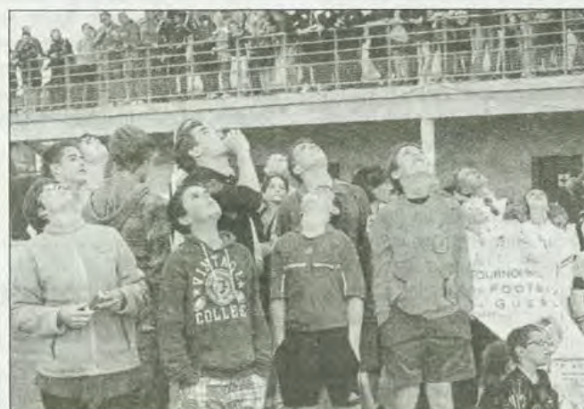
Les spectateurs avaient les yeux rivés sur le ciel, pour suivre l'arrivée des parachutistes.