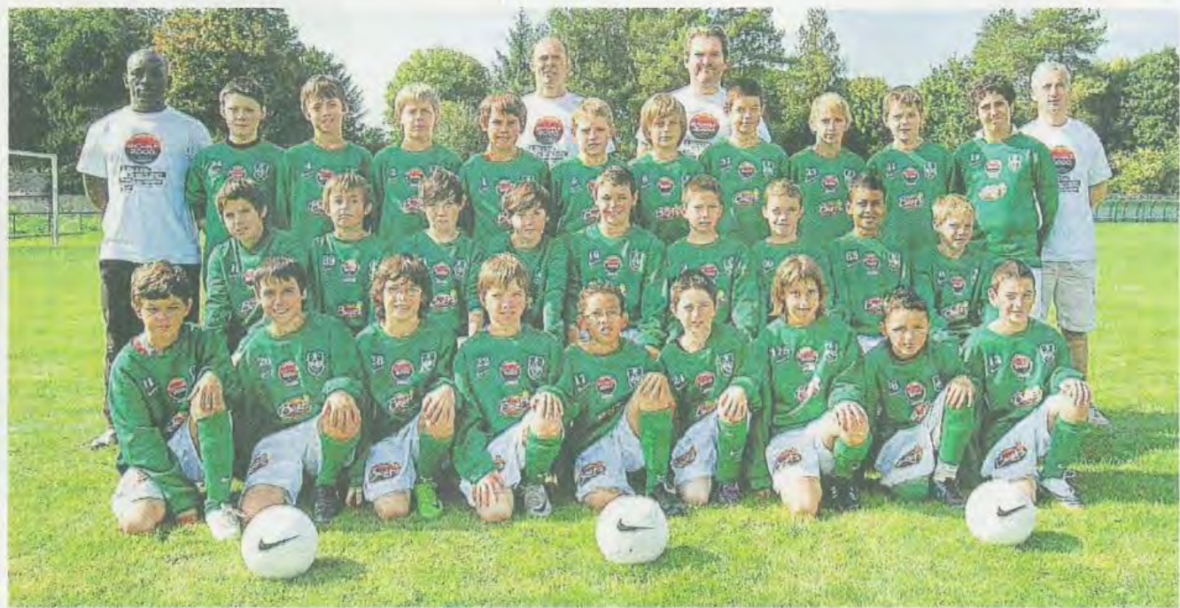
Les jeunes de la GSI participeront comme de coutume à cette 10 e édition.

Cent vingt-huit équipes venues de toute la France sont attendues, mais aussi d'Ukraine, de Lituanie, de Pologne, d'Allemagne et d'Angleterre. « Nous avons reçu 347 demandes d'inscription, pour 128 places. Dix groupes sont encore sur liste