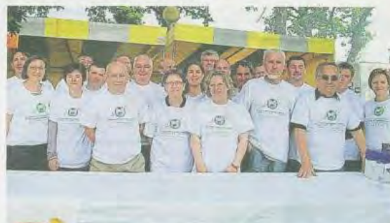
Près de cinq cents bénévoles ont permis le bon déroulement de l'événement ce week-end, ici, à Toulboubou.