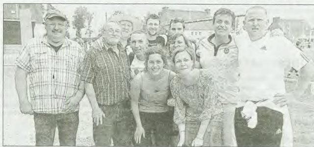
Les supporters du FC Rouen ont donné de la voix pour soutenir leur équipe.

Samedi et dimanche, le Stade mûrois recevait, sur son terrain, 32 des 128 équipes du Tournoi international de Guerlédan. Pour cette dixième édition de l'événement, près d'une centaine de bénévoles et de nombreux supporters avaient fait le déplacement sous un soleil qui jouait à cache-cache en fin de journée. Près des tribunes, une dizaine de personnes était attitrée aux grillades et à différents services. Le long des terrains, les supporters étaient en voix pour soutenir leurs équipes. Venus de Rouen (76), les supporters du FC Rouen étaient une vingtaine à encadrer