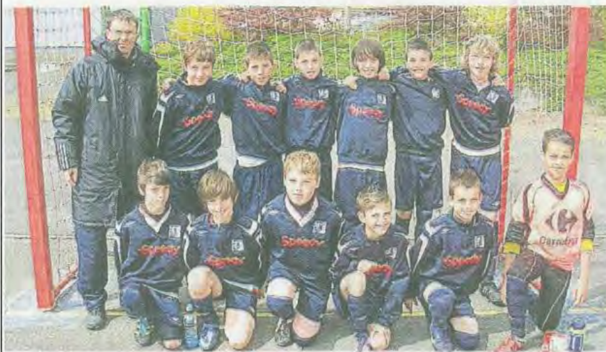
L'équipe de La Roche-sur-Yon, commune jumelée avec Pontivy.

Samedi, de 9 h à 17 h 30, et dimanche de 9 h à 13 h, à Pontivy, Loudéac, Mûr-de-Bretagne, Cléguérec, Neulliac. Phase finale au stade Louis Chevé, à Loudéac, de 13 h 45 à 17 h 30.