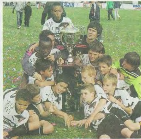
Les joueurs du Stade Rennais sont les grands vainqueurs de l'édition 2012 du TIG en l'emportant 2-0 face à Guingamp.