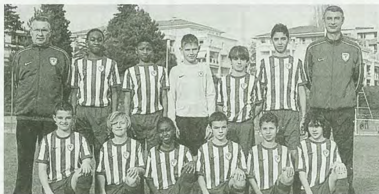
Les jeunes de l'AS Cannes joueront ce samedi à Saint-Bugan face à Caen, Vannes et la Lituanie.

Les phases qualificatives se dérouleront ce samedi de 9 h à 17 h 30 et dimanche de 9 h à 13 h sur les cinq sites, les terrains de Saint-Bugan ayant été retenus à Loudéac. Y évolueront deux équipes de Lituanie, Cannes, Caen, Vannes notamment. Cinq cents bénévoles sont mobilisés, soixante arbitres sollicités pour orchestrer les rencontres. « Nous avons