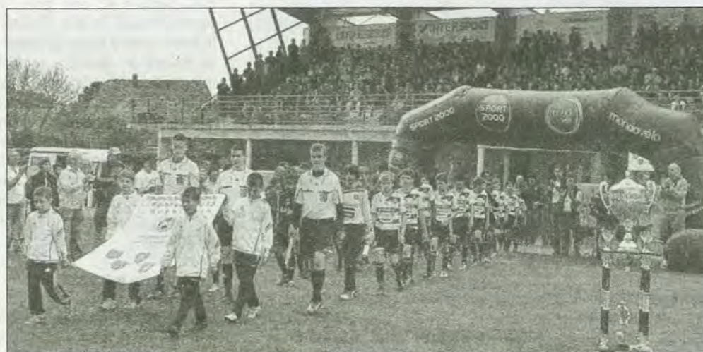
Tout un cérémonial a été mis en scène pour les finales du tournoi principal et celui en consolante. Ci-dessus, l'entrée des deux meilleures équipes, Rennes et Guingamp, précédées par les jeunes du Losc portant le drapeau du tournoi.

Hier, pour la finale du tournoi de Guerlédan, le spectacle n'était pas que sur le terrain où Rennes a signé la victoire. Il était aussi dans les airs, le ballon de la finale arrivant en parachute.