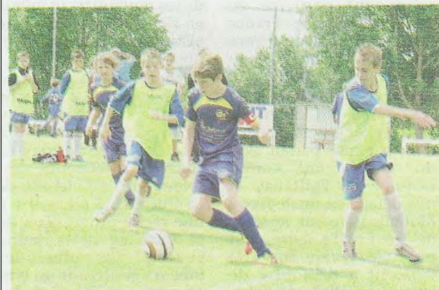
Les jeunes de Cléguérec (en jaune) ont été sortis en 16 e de finale du tournoi consolante.

Si la finale est remportée par le Stade Rennais face à Guingamp, les équipes locales comme Cléguérec, battue en 16 e de finale du tournoi consolante, de la GSI, battu en 16 e de finale du tournoi principal, ou Noyal-Pontivy, battu en finale consolante, n'ont pas démerité.