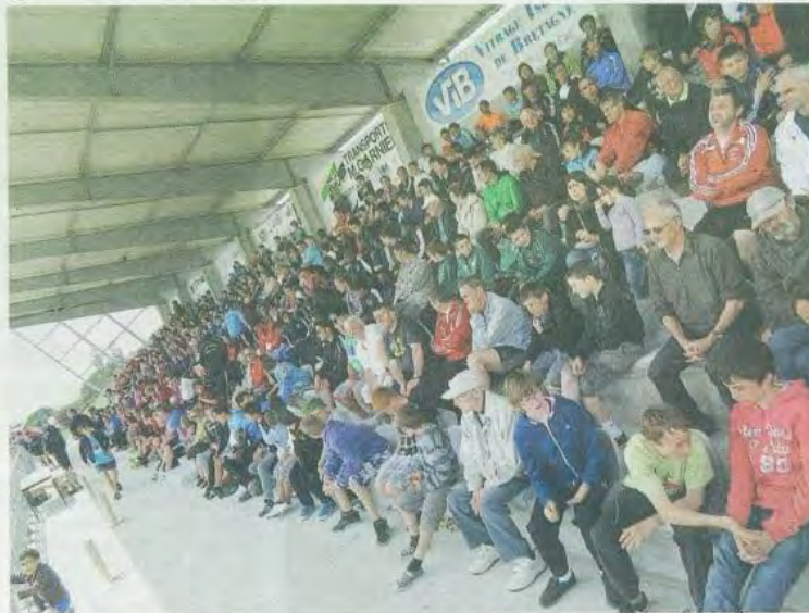
Environ 2 000 personnes ont assisté aux finales du Tournoi international de Guerlédan 2012.

tian Gourcuff a félicité la convivialité et le plaisir de jouer autour du football qu'offrait le Tournoi international de Guerlédan. « Ces moments seront gravés dans vos souvenirs », a-t-il déclaré aux jeunes. Il a également remercié le public pour l'intérêt qu'il lui portait.