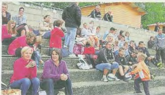
Amis et parents ont applaudi les footballeurs, dimanche matin, au stade de Cléguérec.