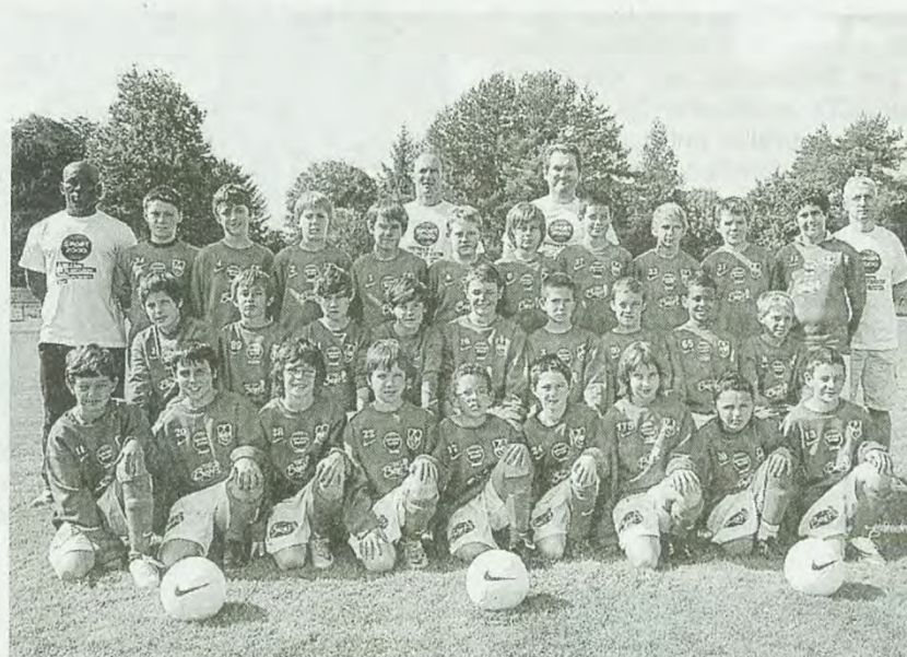
Les jeunes de la GSI participeront comme de coutume à cette 10 e édition.

Cent vingt-huit équipes venues de toute la France sont attendues, mais aussi d'Ukraine, de Lituanie, de Pologne, d'Allemagne et d'Angleterre. « Nous avons reçu 347 demandes d'inscription, pour 128 places. Dix