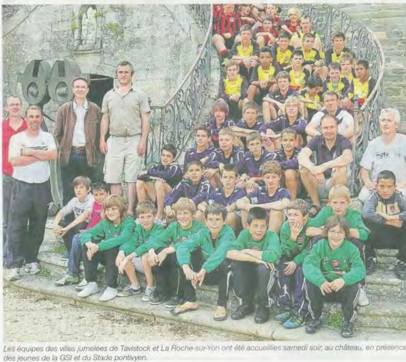
Les équipes des villes jumelées de Tavistock et La Roche-sur-Yon ont été accueillies samedi soir, au château, en présence des jeunes de la GSI et du Stade pontivyen.