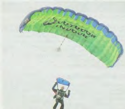
Le ballon de la finale est arrivée par les airs.