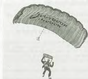
Le ballon de la finale arrive par les airs.

Le public très fourni a été partagé, dimanche, pour la finale du tournoi de Guerlédan des moins de 13 ans, Rennes vainqueur et Guingamp, finaliste, ayant leurs supporters.