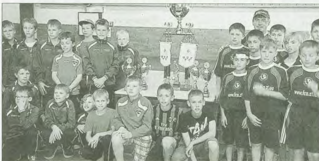
Les jeunes footballeurs des délégations étrangères (Angleterre, Lituanie, Ukraine ou Pologne) ont été chaleureusement accueillis par les organisateurs, vendredi soir, à Mûr-de-Bretagne.

Depuis hier, 128 équipes de la catégorie U13 s'affrontent dans le cadre de la dixième édition du Tournoi international de Guerlédan de football. La finale se jouera aujourd'hui, à Loudéac.