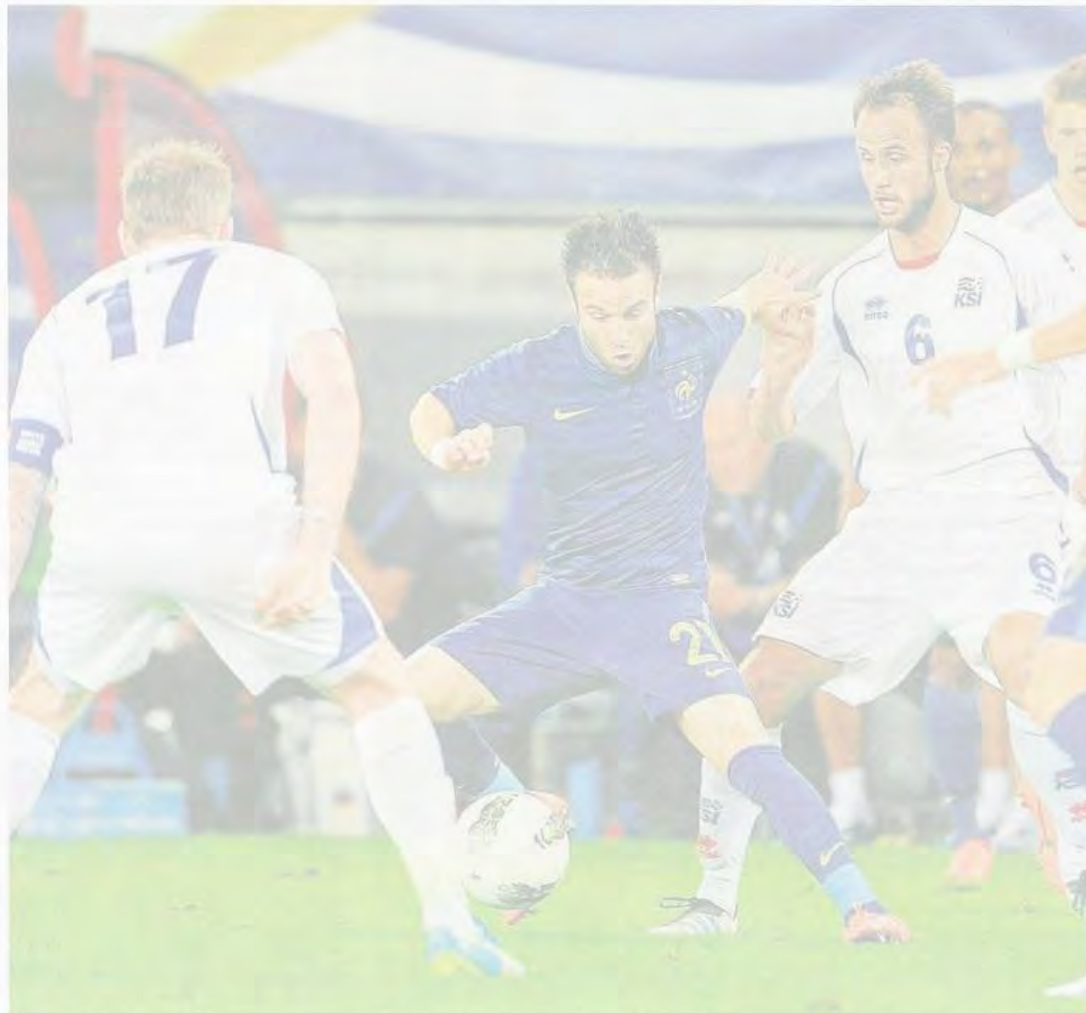
Menée 0-2, la France a finalement battu l'Islande 3-2. Il faudra être plus rigoureux lors de l'Euro. pages 8 et 9