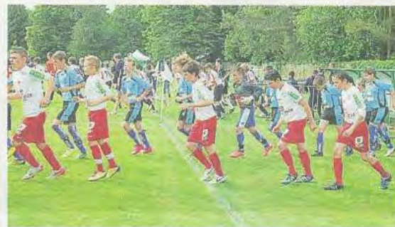
Les footballeurs, filles et garçons, ont donné le meilleur d'eux-mêmes.