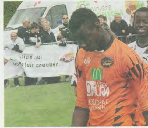
Suite à leur défaite, les U13 du Losc ne cachaient par leur déception.