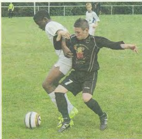
Les duels au ballon sont monnaie courante et de plus en plus nombreux dans les finales.