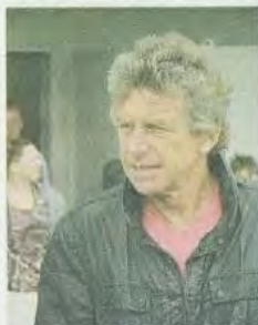
Christian Gourcuff était le parrain de cette édition 2012. Il s'est donc déplacé pour les finales.

Le Tournoi international de Guerlédan, c'est aussi des centaines de bénévoles travaillant sans relâche au bon déroulement du tournoi. Les finales se sont déroulées cette année au stade Louis-Chevé, choisi pour sa qualité. L'édition 2012 a été remportée par Rennes