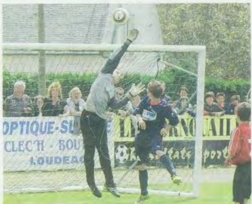
Nombre d'erreurs sur le terrain ont été rattrapées par les gardiens lors du tournoi.

Consolante : Mouzeille Tigné Ligné - Noval-Pontivy (0-3) ; US Montagne - Trégunc (1-0). Finale : US Montagne - Noyal-Pontivy (1-0).